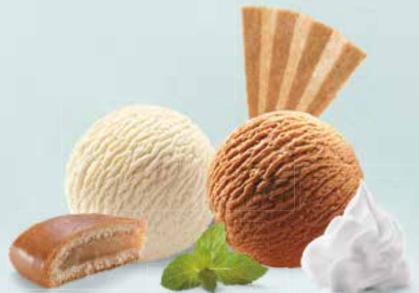
Biberli Coupe Vanille-, Café-Glace, mit Biberli-Stückli und Rahm CHF 12.00