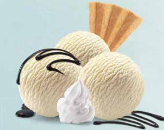
Coupe Danmark Vanille-Glace mit Schokoladensauce und Rahm CHF 12.00