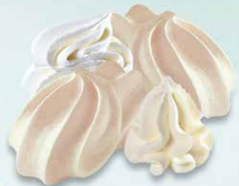
Meringues Meringues mit Rahm CHF 12.00