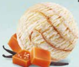
Vanille & Caramel salé Rahmglace