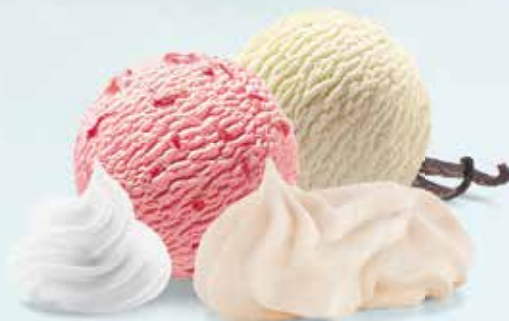
Meringues Glace Vanille-, Erdbeer-Glace mit Meringues und Rahm CHF 13.00 / mini CHF 11.00